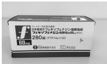
フェキソフェナジン塩酸塩錠60mg「ダイト」 アレルギー性疾患治療剤 特徴：