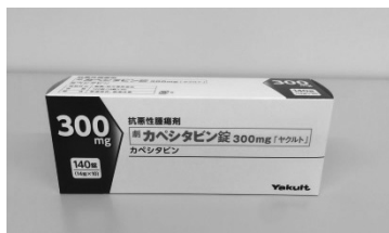
カベシタピン錠300mg「ヤクルト」 抗悪性腫瘍剤