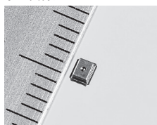
小型低背タイプフォースセンサ

外形寸法が2.2mm×1.8mm×1.0mmMaxの超小型・薄型タイプのフォースセンサです。小型でありながら、20N以下の微小荷重を高感度、高精度で計測することができ、出力がリニアで使用しやすいことが特徴です。電子ペン等の入力用の他、各種微小荷重の検知・計測用に最適です。