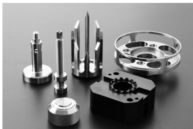
単品の部品加工もご相談下さい。