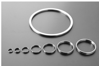
薄肉リングの旋削加工品 外径φ20~200まで対応可能です。