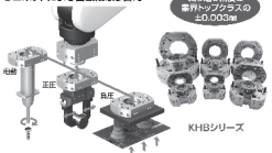
ロボットツールが全て揃います