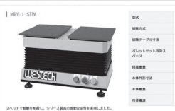
水平対向式パーツ整列機