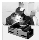
セントラルリングクランプ P.1