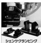
ショッククランプ システム P.5