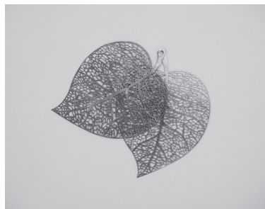
精密薄板金属レーザ加工 径40μのビーム