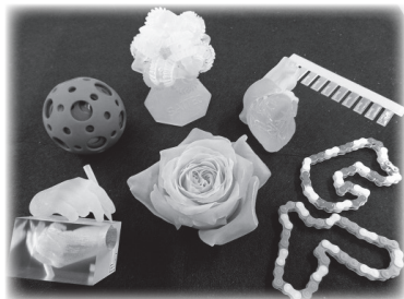
カラー3Dプリンタの試作例(技術支援)