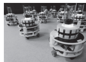
実機ロボティックスワーム