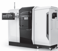
【NEW】 レーザー金属積層造形機 LASERTEC 30 SLM 2nd Generation